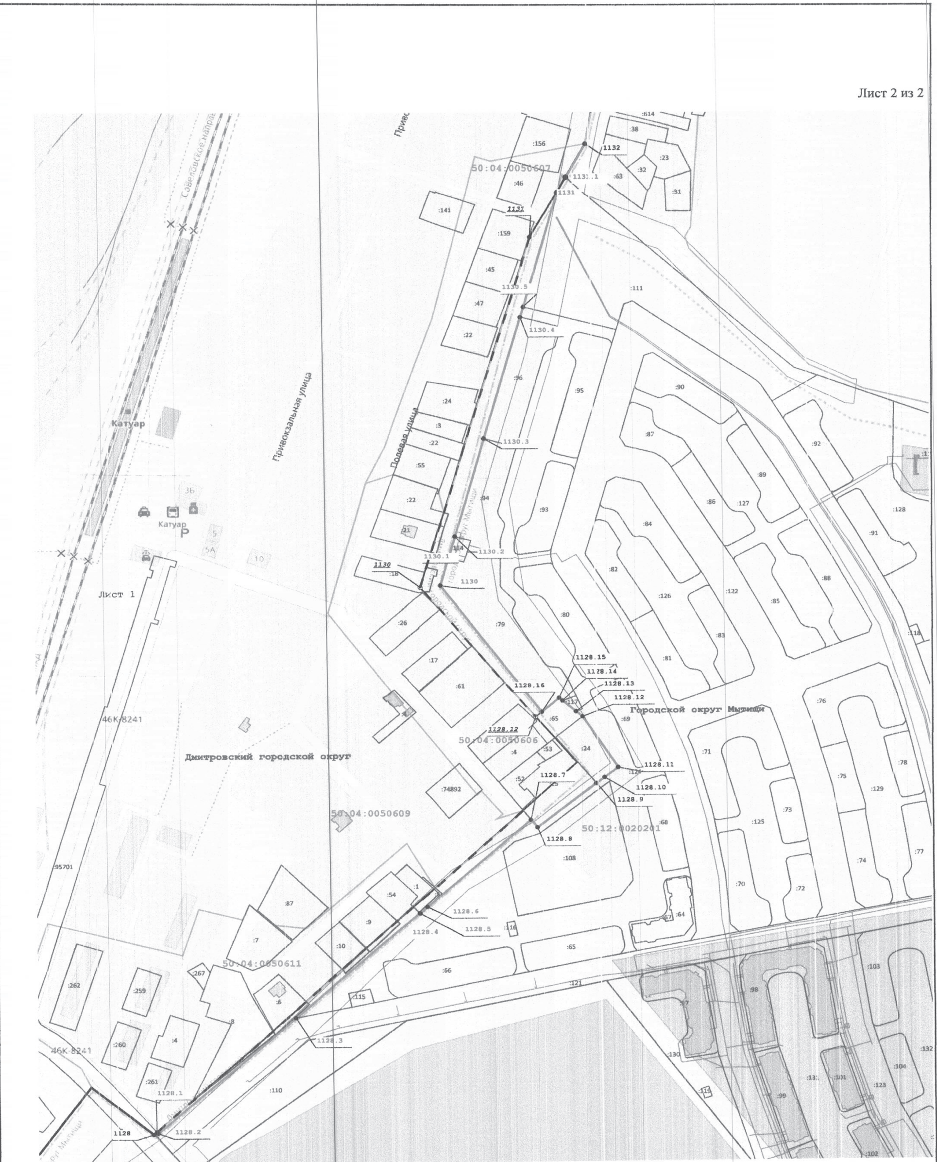
Масштаб 1:2 800